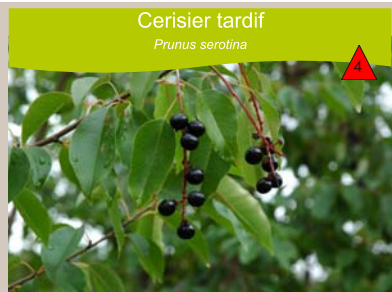
Cerisier tardif Prunus serotina

Forêts, landes et friches. Naturalisé dans les chênaies, landes et pelouses sèches, sur sols à pH acide et texture sableuse. Arbuste de 2 à 8 m ou petit arbre de 12 à 15 m de haut.