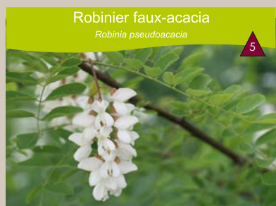
Robinier faux-acacia Robinia pseudoacacia

Berges des rivières, forêts alluviales, haies, friches. Liane rampante ou grimpante grâce à ses vrilles, généralement de 1 à 10 m, pouvant atteindre 15 m de long.