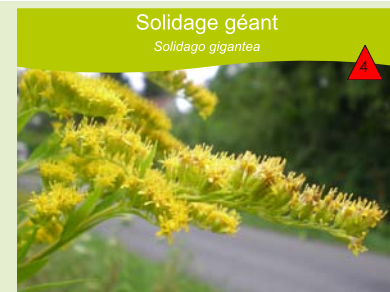
Solidage géant Solidago gigantea

Berges des cours d'eau, lisières forestières, talus, bords de routes, bords de voies ferrées, friches. Plante vivace à rhizome, plus ou moins glabre, atteignant 1 à 3 m de haut.