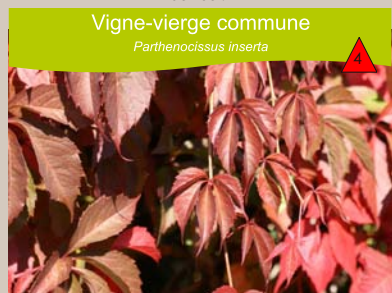
Vigne-verge commune Parthenocissus inserta

Forêts, landes et friches. Naturalisé dans les chênaies, landes et pelouses sèches, sur sols à pH acide et texture sableuse. Arbuste de 2 à 8 m ou petit arbre de 12 à 15 m de haut.