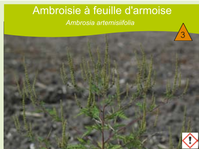
Ambroisie à feuille d'armoise Ambrosia artemisiifolia

Milieux agricoles, bords de route, friches industrielles, zone d'étiage des rivières. Plante annuelle à germination printanière, pubescente, de 20 à 200 cm.