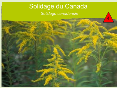
Solidage du Canada Solidago canadensis

Ripisylves, berges caillouteuses des rivières, forêts alluviales, lisières et coupes forestières, fossés, talus humides. Plante annuelle dressée, glabre, de 1 à 2 m de haut, pouvant dépasser 2 m.