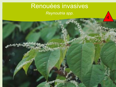
Renouées invasifs Reynoutria spp.

Berges de rivières, pelouses et prairies humides, fossés, marais, bords de canaux, bords de route. Plante vivace stolonifère et rhizomateuse, de 20 à 50 cm.