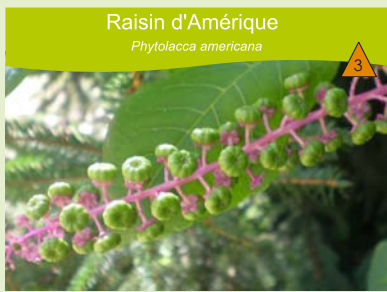
Raisin d'Amérique Phytolacca americana

Berges de rivières, bords de routes et de voies ferrées, abords des habitations, friches, gares, décombres... friches. Plante vivace atteignant 2 à 3 m, voire 5 m de hauteur !