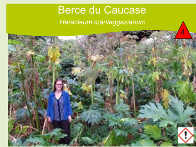
Berce du Caucase Heracleum mantegazzianum

Ripisylves, berges des cours d'eau, clairières des forêts alluviales, prairies fraîches à humides. Plante vivace à stolons souterrains, de 60 à 150 cm de haut. Tiges dressées à nombreuses feuilles.