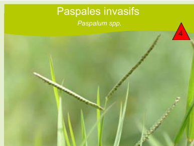
Paspales invasifs Paspalum spp.

Prés, friches, bords de route, fossés, talus, bords de ruisseaux. Plante vivace dressée, atteignant 40 cm à 1 m de haut, presque glabre.