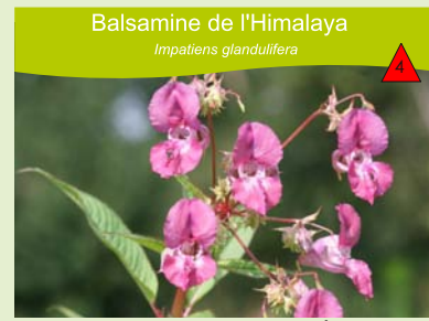
Balsamine de l'Himalaya Impatiens glandulifera

Bords de routes, ripisylves, coupes et lisières forestières, abords des habitations, friches, gares, décombres... Plante vivace glabre de 1 à 3 m de haut.