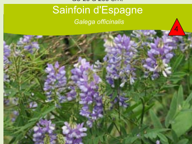
Sainfoin d'Espagne Gallega officinalis

Milieux agricoles, bords de route, friches industrielles, zone d'étiage des rivières. Plante annuelle à germination printanière, pubescente, de 20 à 200 cm.