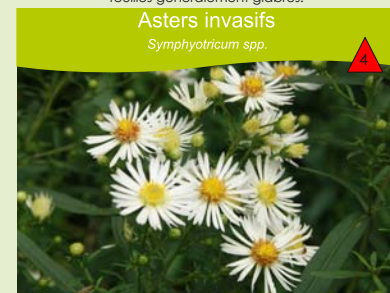
Asters invasifs Symphyotricum spp.

Bords des voies de communication, friches, prairies humides, mégaphorbiaies, ripisylves, roselières. Plante vivace à rhizome, haute de 50 à 200 cm, tiges et feuilles généralement glabres.